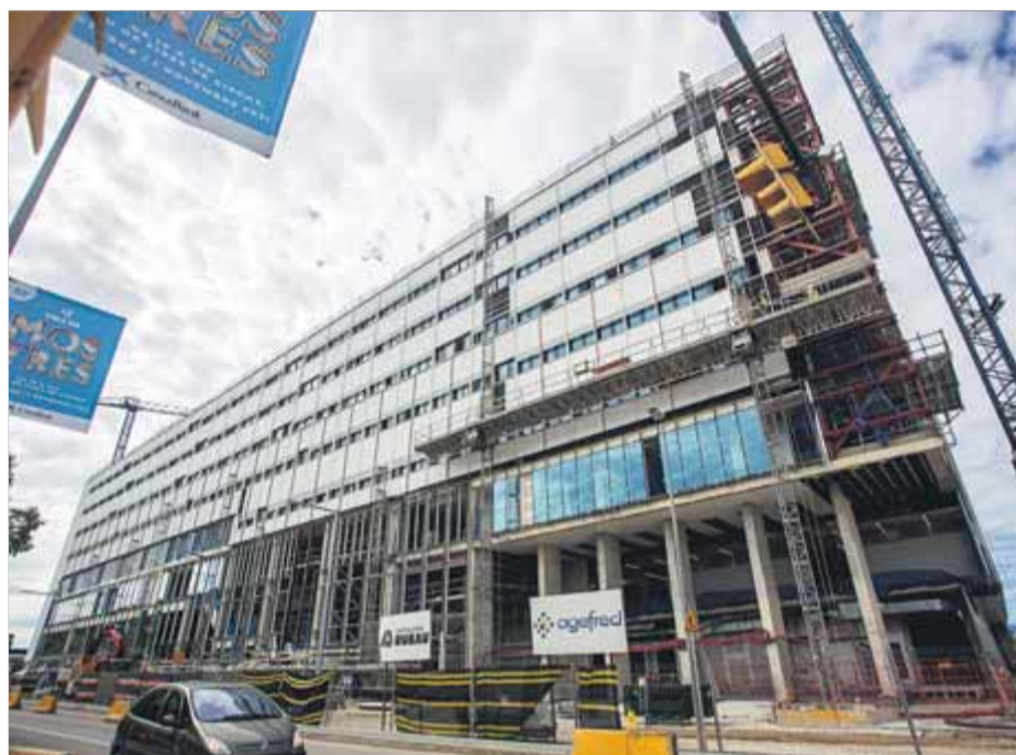
L'edifici de Clínica Girona a la carretera de Barcelona aquesta setmana

Aprofitant el fet que aquell cap de setmana de pont és habitualment de baixa activitat, al carrer Maragall ja només s'aten-