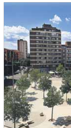
La plaça de la Llibertat de Salt, al juliol

Durant el procés es va informar que, en aquesta